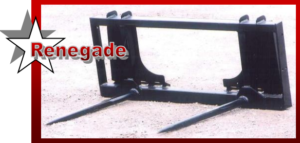
SHOWN WITH UNIVERSAL SKID STEER Q-TACH DÉMONTÉ