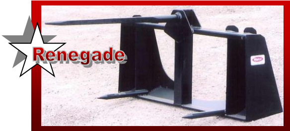
SHOWN WITH UNIVERSAL SKID STEER Q-TACH DÉMONTÉ