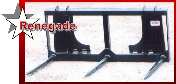
SHOWN WITH UNIVERSAL SKID STEER Q-TACH DÉMONTÉ