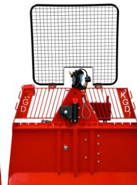
6.5 Ton Radio Control