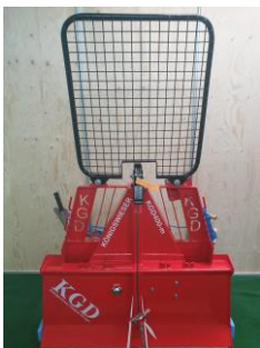
4.0 Ton "Towing coupler extra"