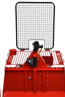
5.5 Ton Manual/Radio