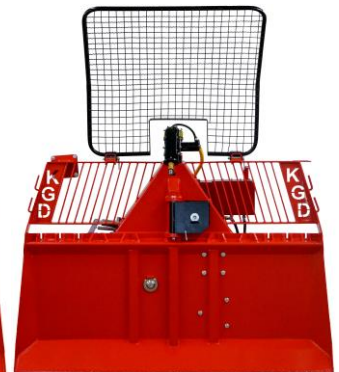
8 Ton Radio Control

MANUAL WINCHES: From 3.5 – 6.5 tons. We recommend 2 man use for these machines.