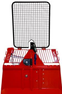
4.5 Ton Manual/Radio