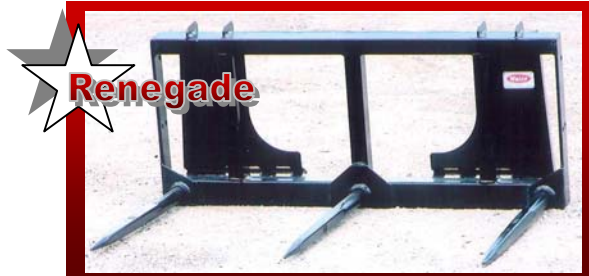
SHOWN WITH UNIVERSAL SKID STEER Q-TACH DÉMONTRE