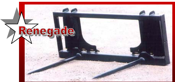
SHOWN WITH UNIVERSAL SKID STEER Q-TACH DÉMONTRE