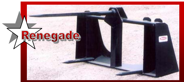
SHOWN WITH UNIVERSAL SKID STEER Q-TACH DÉMONTRE